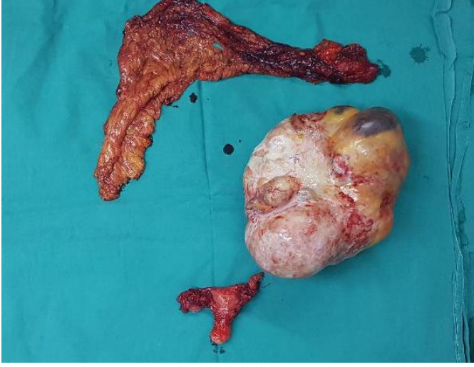
Resim 1. Tek taraflı over tümörü